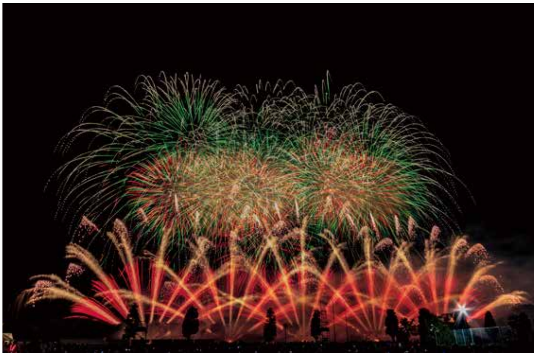
沼田花火大会(沼田市)