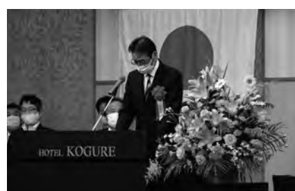
〔前橋地方法務局 佐藤局長〕