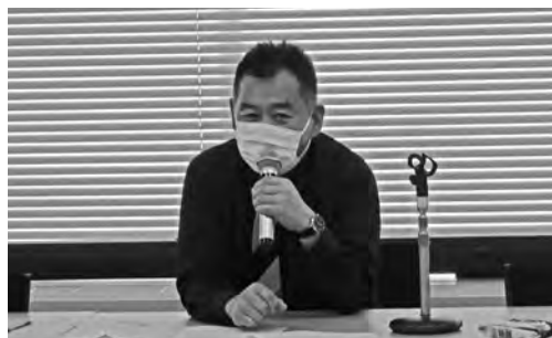
〔吉野広報事業部長〕