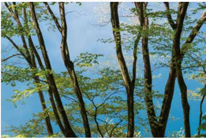
奥四万湖(中之条町)