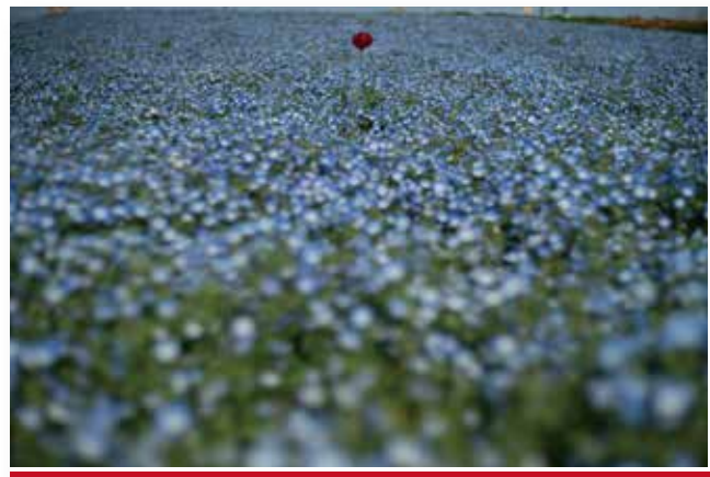
鼻高展望花の丘(高崎市)